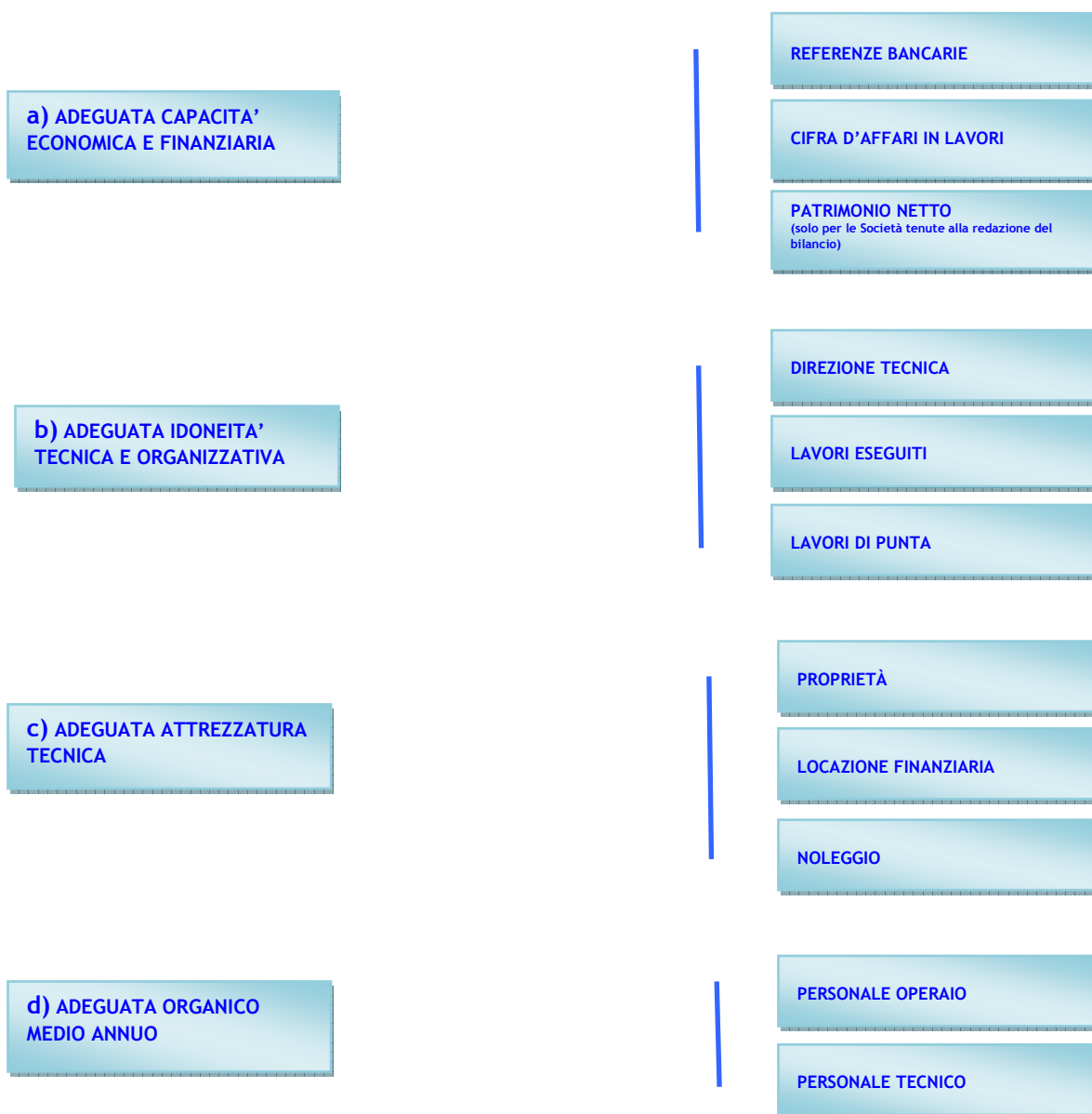
figura 1: Requisiti di ordine speciale